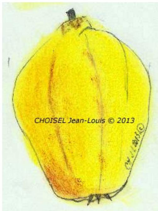
BERECZKI.= Monstrueuse de Vranja.