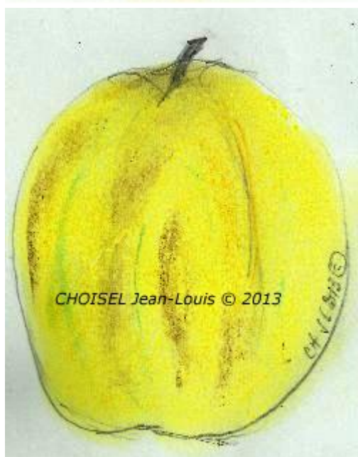
GEANT DE LESKOVAC.